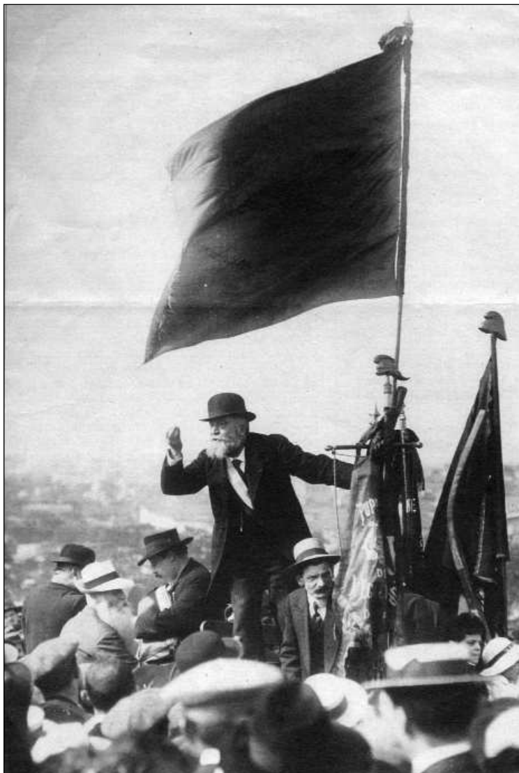
Le 25 mai 1913 au Pré Saint-Gervais, Jaurès prononce un discours contre le service militaire de trois ans.

Né en 1900 près de Bordeaux, où son père était em-