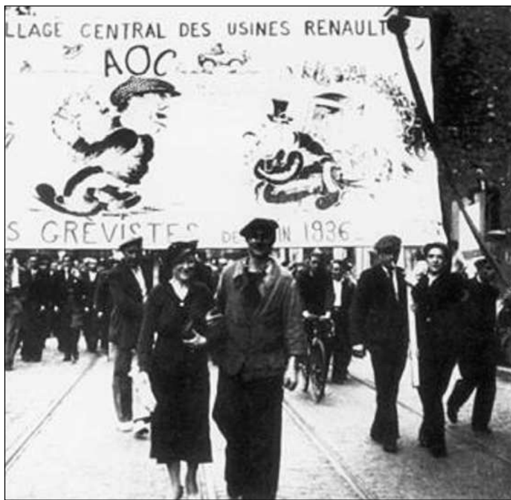
Manifestation des ouvriers devant les usines de Renault-Billancourt en juin 1936

C'est bien le problème qui est posé par l'étude économique du Front populaire. Si en effet sa politique ne fut guère socialiste au sens où nous l'avons posée, c'est que l'État n'en avait pas les moyens : peu d'experts, peu "d'hommes de l'État", une fonction publique limitée et l'absence de volonté d'infléchir le sens général de l'économie. Bien sûr, des esprits nombreux, souvent brillants, pensent à cette action de l'État. On peut citer le groupe X-Crise et d'autres encore très bien étudiés dans le livre de François-Georges Dreyfus sur les origines de Vichy.