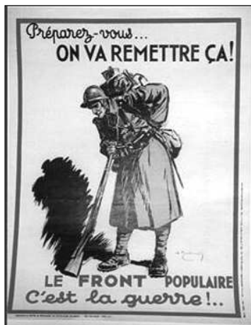
Une affiche de propagande prémonitrice

Du point de vue technique, même si le Front populaire va désorganiser la production industrielle française avec les 40 heures, dont l'impact a été considérable, en même temps il relance notre production militaire : si nous